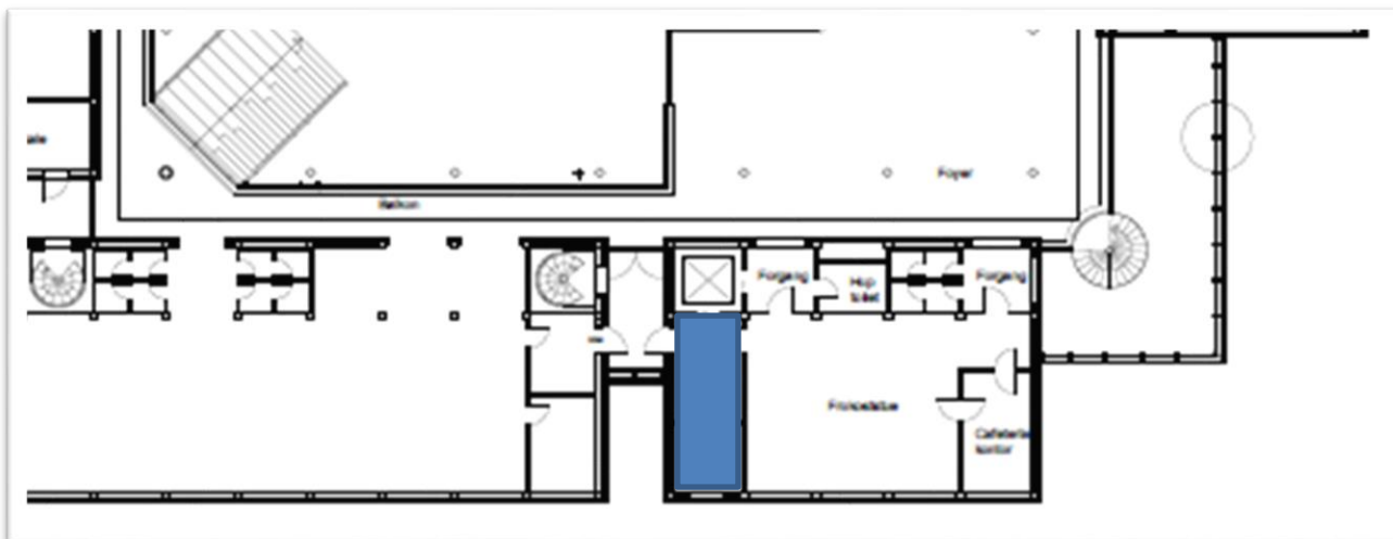
Udsnit af bibliotekets 1. sal